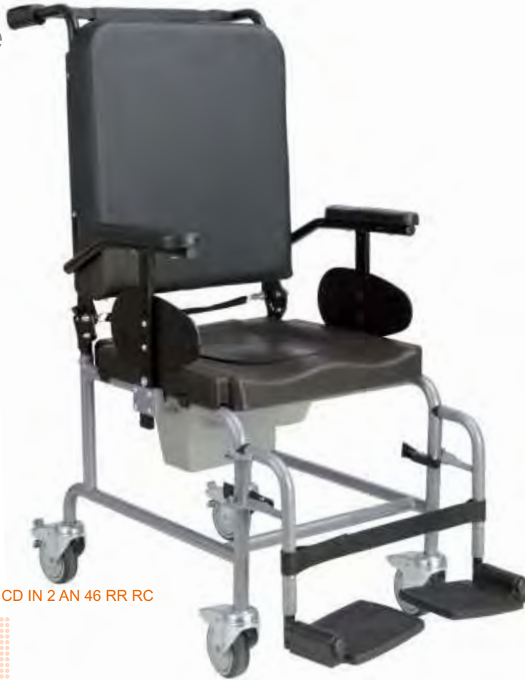
CD IN 2 AN 46 RR RC