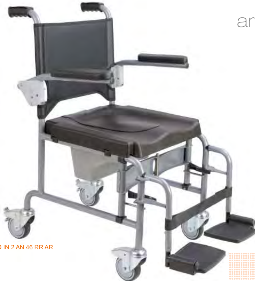
CD IN 2 AN 46 RR AR

Com estrutura em aço assento anatómico sanitário e 4 rodízios de Ø100mm. A ANDALUS reúne 4 funções numa só cadeira: com o conforto de uma cadeira de interior, permite a utilização sanitária ou directamente no wc e é dobrável para facilitar o transporte e arrumação. O assento com 46cm cumpre a necessidade do utilizador. Com patins rebatíveis de abertura lateral. Também disponível a versão ANDALUS fixa 4 rodízios.