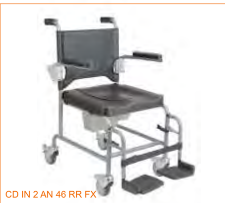
CD IN 2 AN 46 RR FX